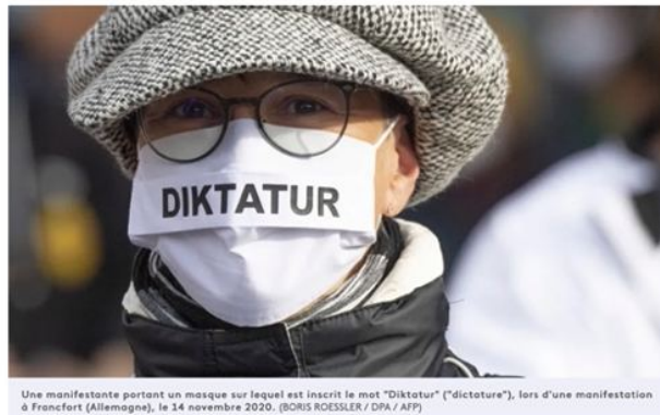
Une manifestante portant un masque sur lequel est inscrit le mot "Diktatur" ("dictature"), lors d'une manifestation à Francfort (Allemagne), le 14 novembre 2020.